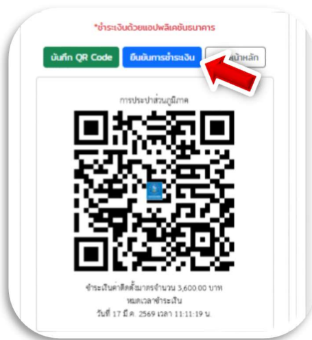
ภาพที่ 5 : ยืนยันการชำระเงิน